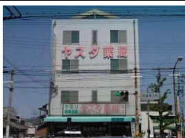
ヤスタ薬局 徒歩4分(330m)