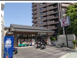
スーパー「 Fresco」 徒歩4分(360m)