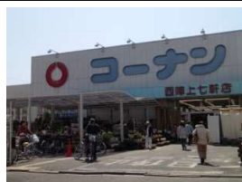
日曜大工「コーナン」 徒歩10分(780m)