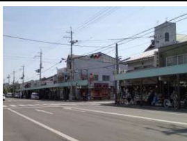
千本通り商店街 徒歩4分(290m)