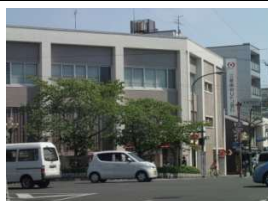
三菱東京UFJ銀行 徒歩11分(860m)