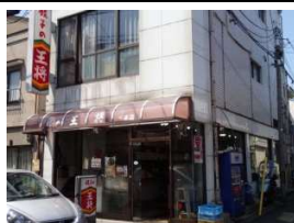
餃子の王将 徒歩3分(190m)